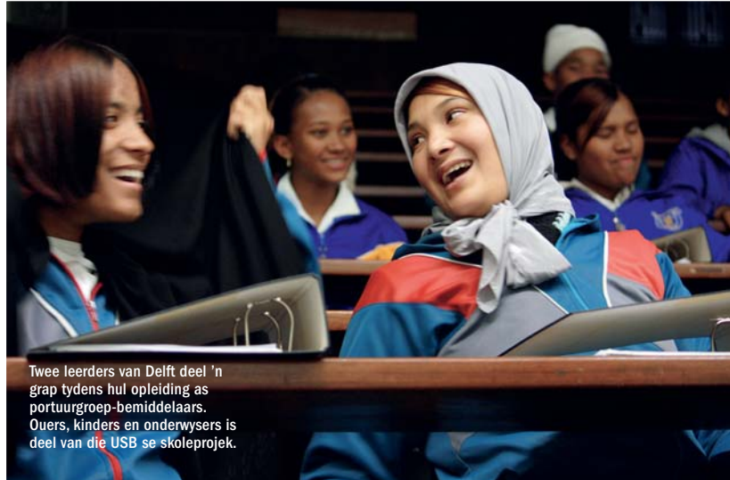
Twee leerders van Delft deel 'n grap tydens hul opleiding as portuurgroep-bemiddelaars. Ouers, kinders en onderwysers is deel van die USB se skoleprojek.